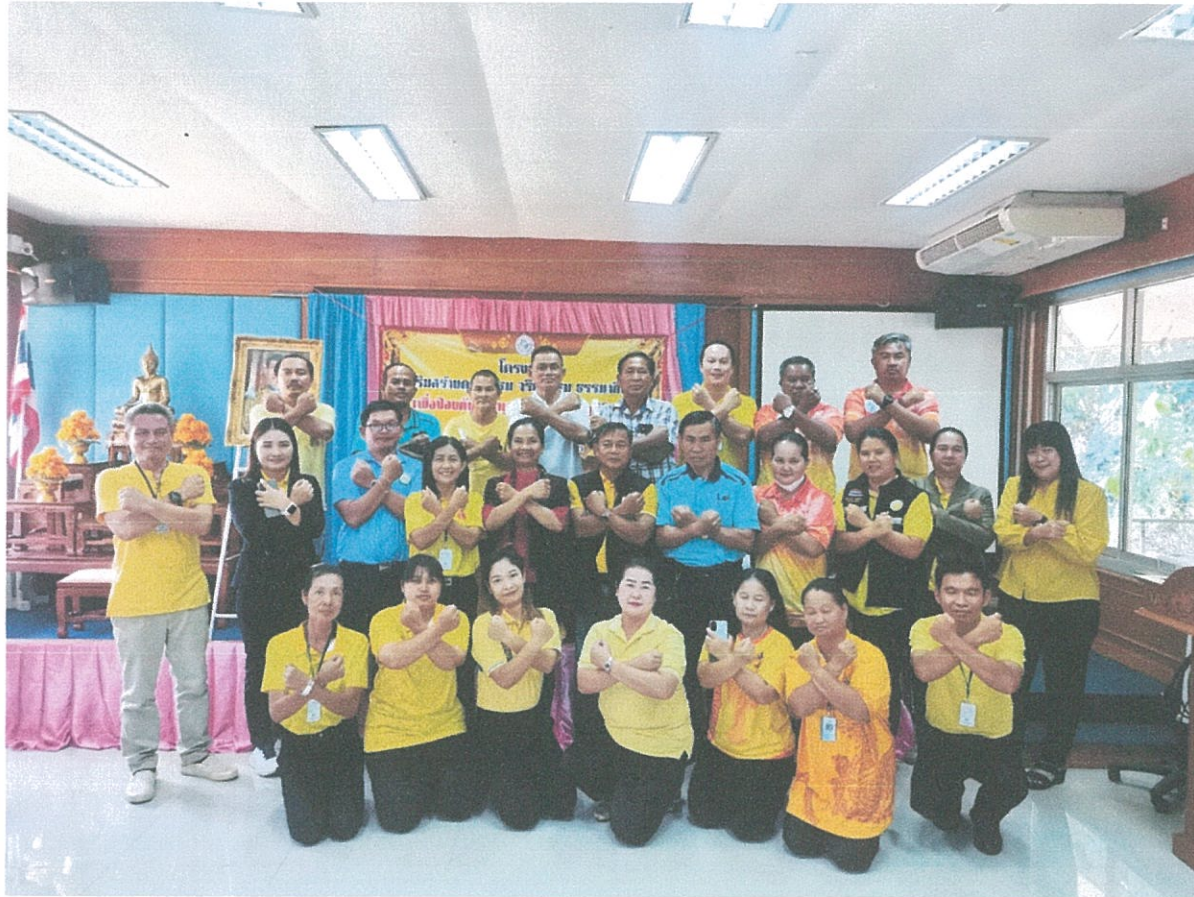
ภาพกิจกรรมการฝึกอบรมตามโครงการเสริมสร้าง คุณธรรม จริยธรรม ธรรมาภิบาลเพื่อป้องกันการทุจริตและ ประพฤติมิชอบ ประจำปีงบประมาณ พ.ศ. ๒๕๖๗